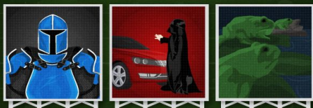
Bud Light Game of Thrones 2019

(Unsere Auswahl der ikonischsten Super-Bowl-Werbespots)