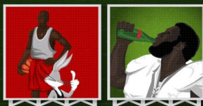
Nike Hase Jordan 1993